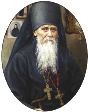
Преподобные Оптинские старцы: Амвросий, Антоний и Анатолий и Иосиф

Преподобный Антоний писал: «Апостол не говорит: «умирает ли кто из вас?», но болит ли кто , пусть призовет пресвитера, и воздвигнет его Господь. Мы же, по губительному неверию, прибегаем сперва к внешней помощи. Когда уже нет более никакой надежды, при-